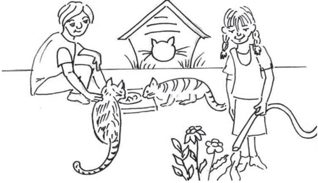
HAYVANLARI VE BİTKİLERİ KORUMA SORUMLULUĞU