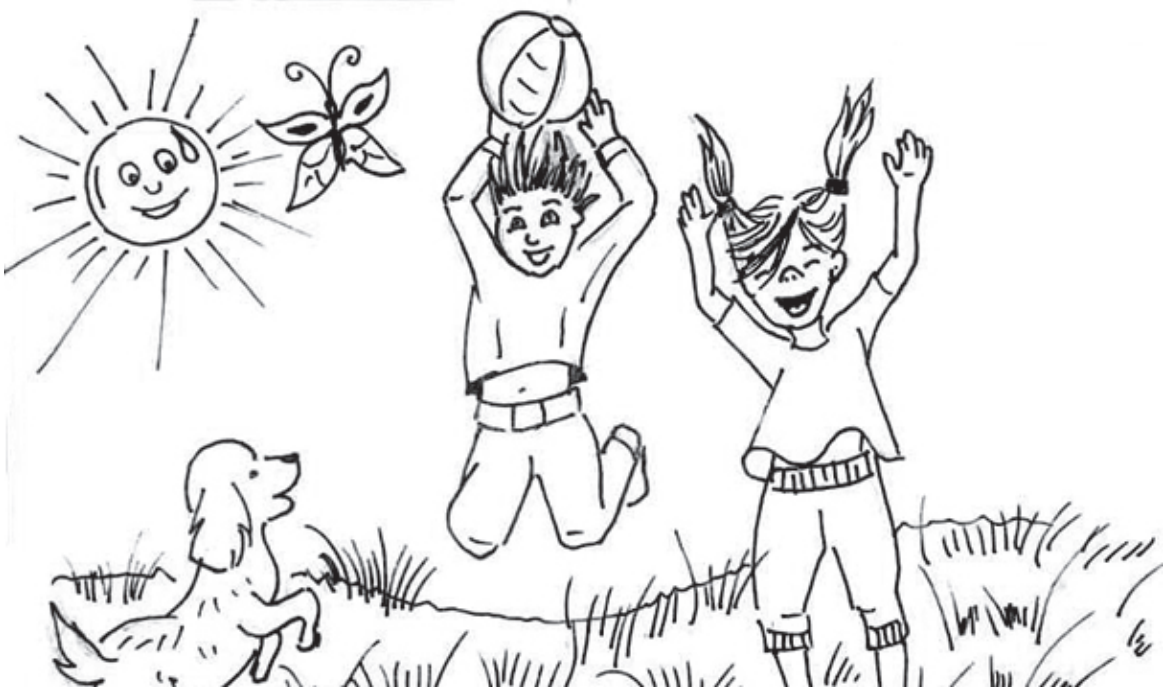
ARKADAŞLARI VE DİĞER İNSANLARLA İYİ ANLAŞMA SORUMLULUĞU

ÇİZEN: Ayşe TURHAN(Görsel Sanatlar Öğretmeni)