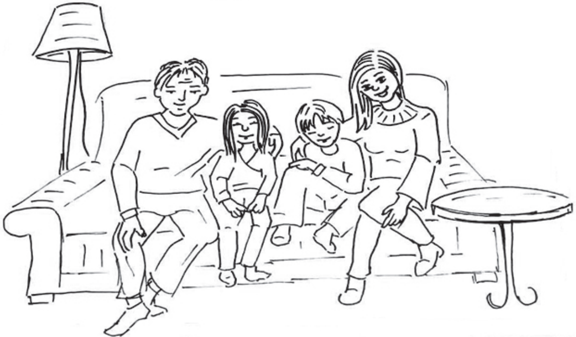
AİLESİYLE YA DA UYGUN BİR ORTAMDA YAŞAMA HAKKI